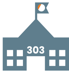
Aantal deelnemende schoollocaties